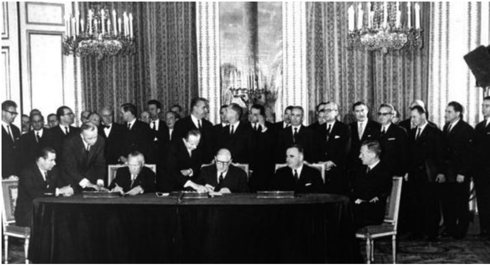
Paris, Unterzeichnung Elysée-Vertrag.