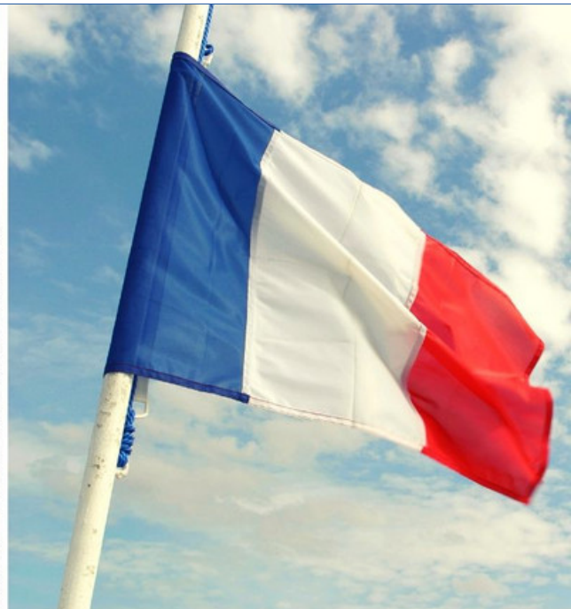
Deutsch-französische Freundschaft.